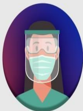
2 Vacinadores por turno

É recomendada a presença de 2 (dois) vacinadores para cada turno de trabalho, conforme o porte do serviço de saúde, e tamanho da população sob sua responsabilidade.