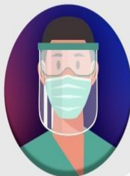
Técnico ou Auxiliar de Enfermagem

É recomendada a presença de 2 (dois) vacinadores para cada turno de trabalho, conforme o porte do serviço de saúde, e tamanho da população sob sua responsabilidade.